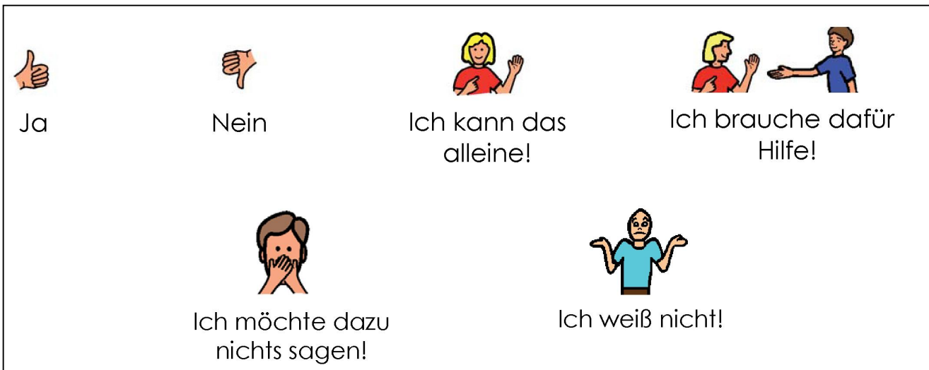
Abbildung: Beispiele aus dem Material des HIP-Koffers

Im Koffer gibt es auch kleine Figuren und Möbel. Zum Beispiel eine Badewanne oder eine Küche.